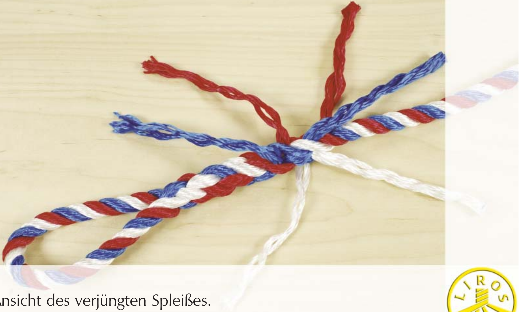
Ansicht des verjüngten Spleißes.