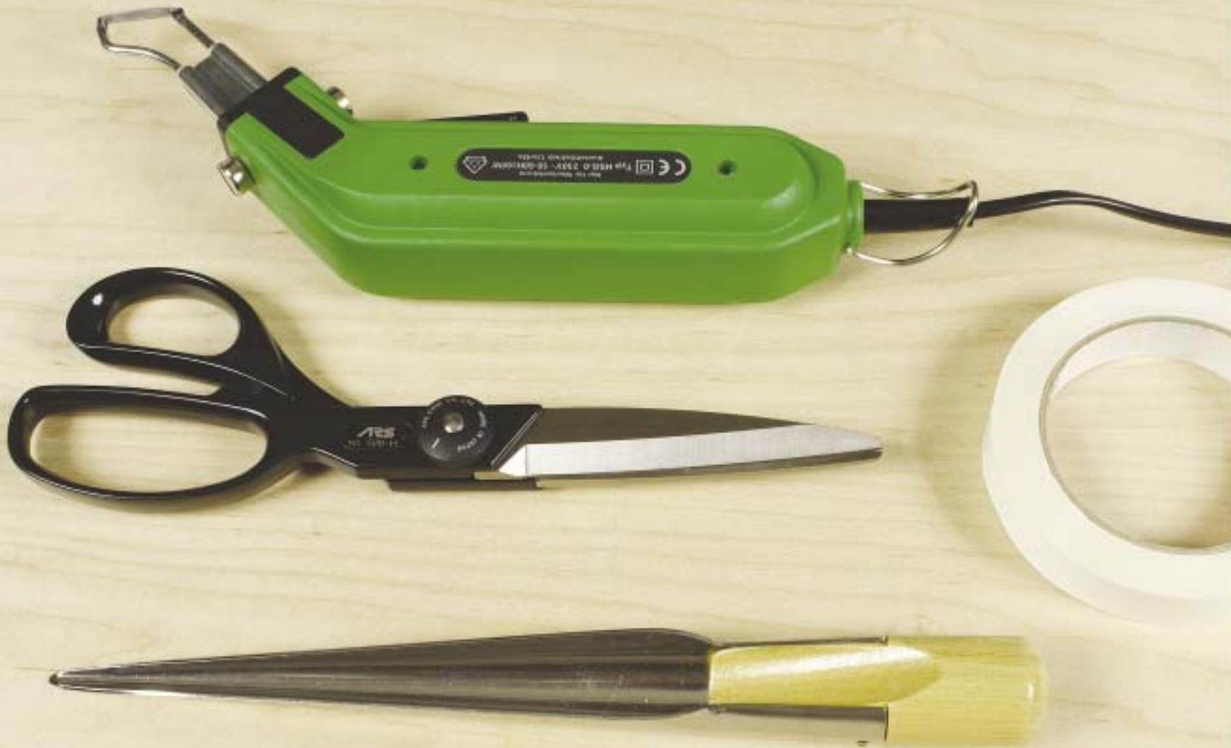
Werkzeug (Tape nur für Naturfasertauwerk)