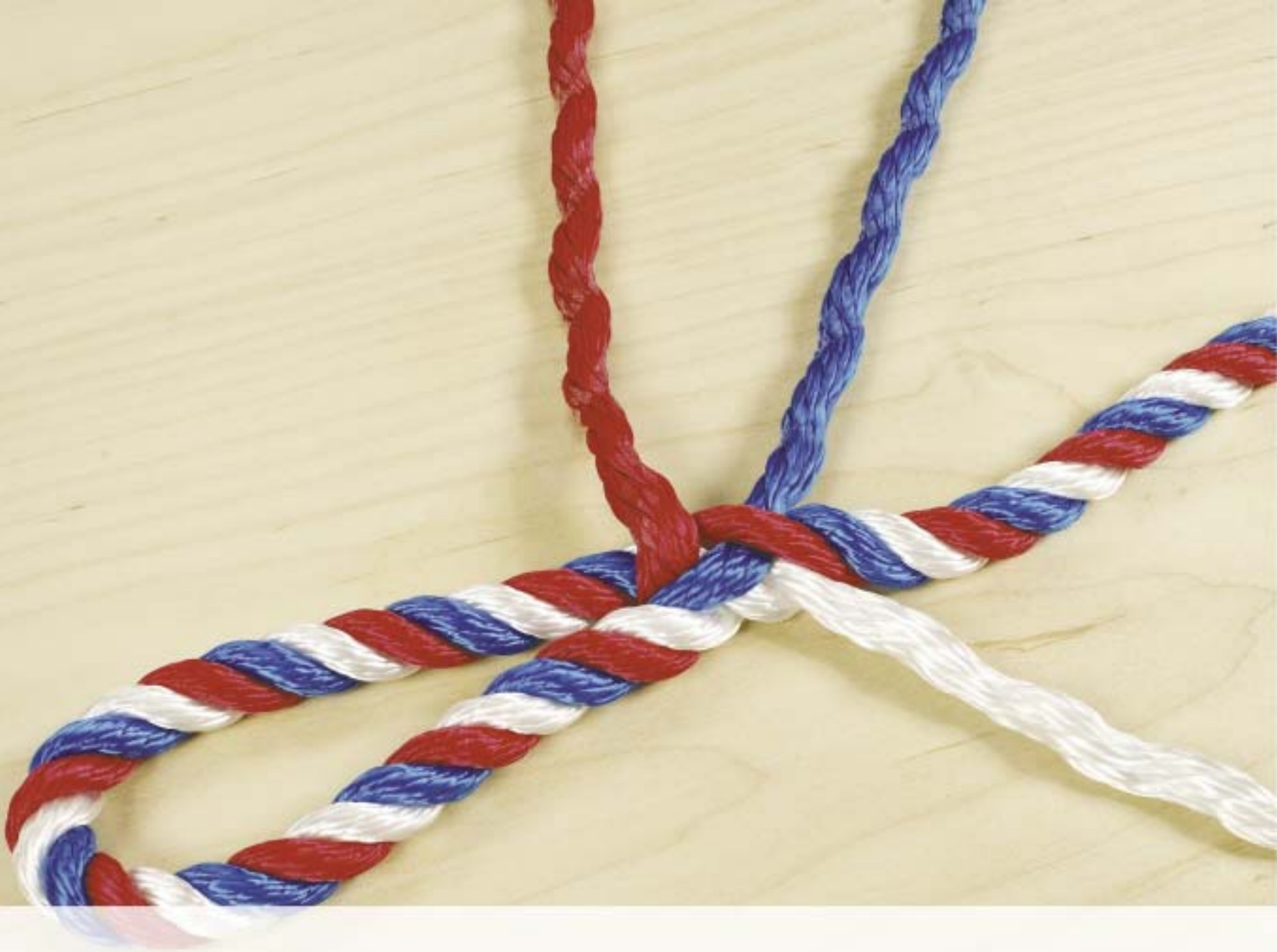
Ansicht der 2. durchgesteckten Litze.