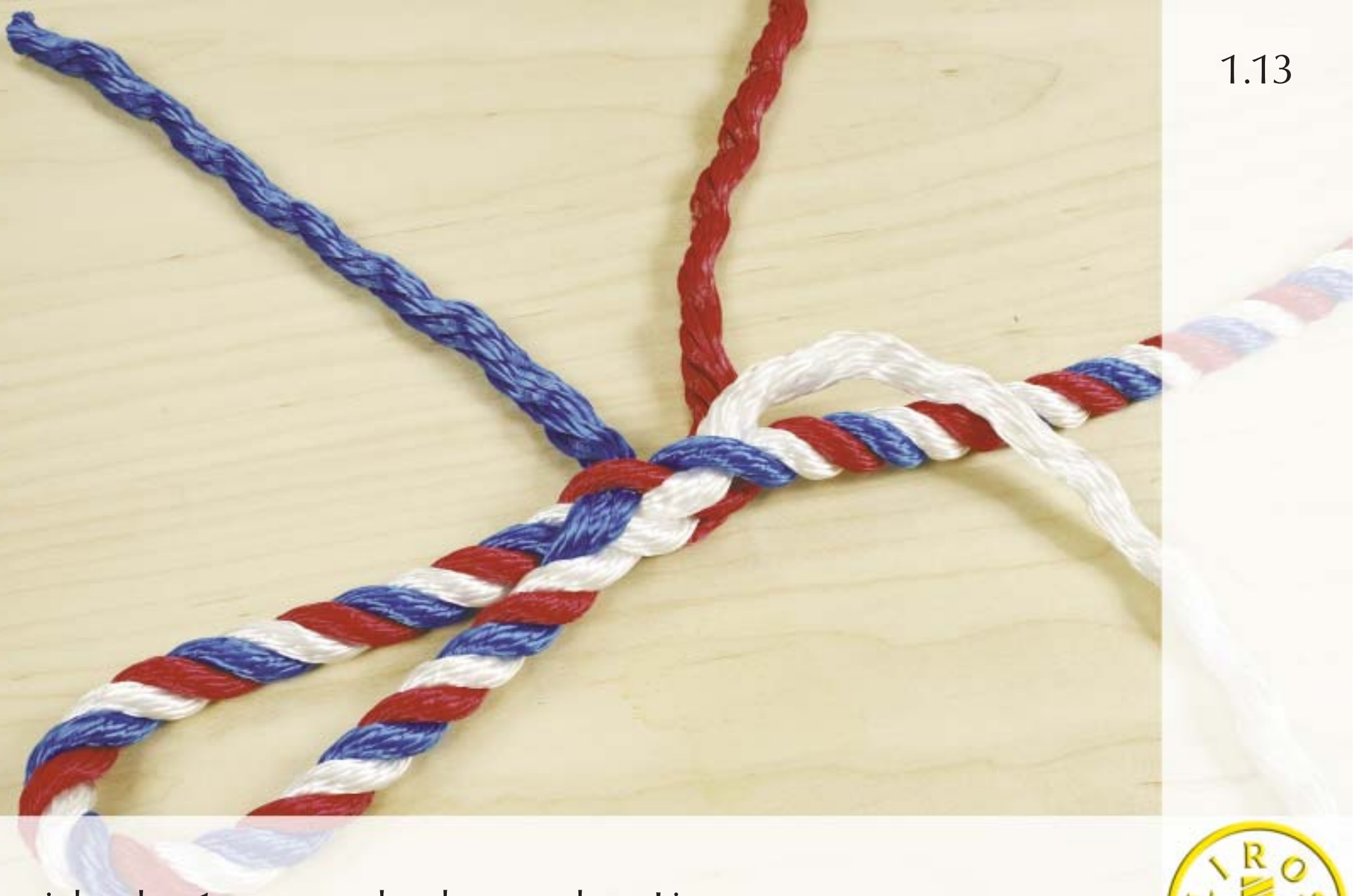
Ansicht der 1. neuen durchgesteckten Litze.